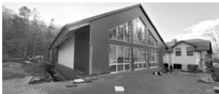
Budowa sali gimnastycznej przy Szkole Podstawowej nr 2 w Cięcinie

W pierwszej kolejności pragnę przybliżyć Państwu szeroki zakres inwestycji, które z powodzeniem realizujemy oraz będziemy kontynuować w przyszłym roku.