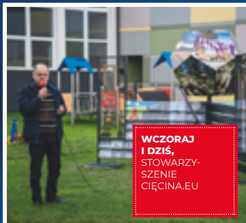
WCZORAJ I DZIŚ, STOWARZY- SZENIE CIĘCINA.EU