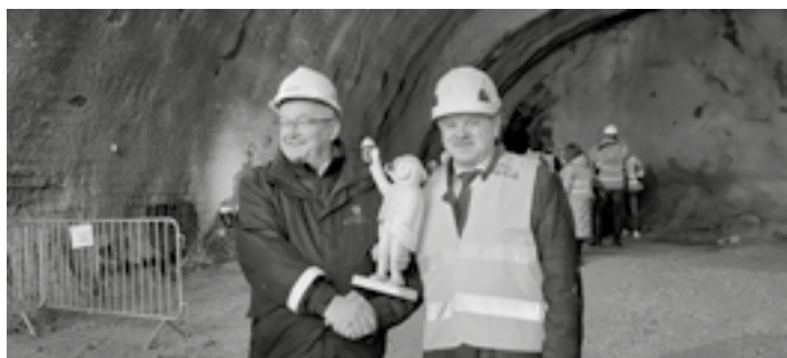
Uroczystości związane z przebieciem pierwszego tunelu przy budowie obejścia Węgierskiej Górki

wodociągowej wraz z przyłączami w rejonie ul. Bukowina w Węgierskiej Górce, ul. Rowerowej w Żabnicy, ul. Tynionka w Ciścu oraz budową sieci wodociągowej wraz z przyłączami do zespołu obiektów basenowo-rekreacyjnych w rejonie ul. 3 Maja w Węgierskiej Górce. Wykonano opracowanie dokumentacji kosztorysowej, przedmiaru robót i specyfikacji technicznej do projektu pt. „Budowa odcinka sieci kanalizacyjnej wraz z przyłączami w miejscowości Cięcina”.