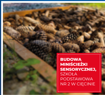
BUDOWA MINIŚCIEŻKI SENSORYCZNEJ, SZKOŁA PODSTAWOWA NR 2 W CIĘCINIE