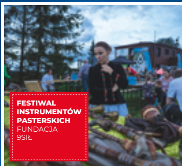
FESTIWAL INSTRUMENTÓW PASTERSKICH FUNDACJA 9SIŁ