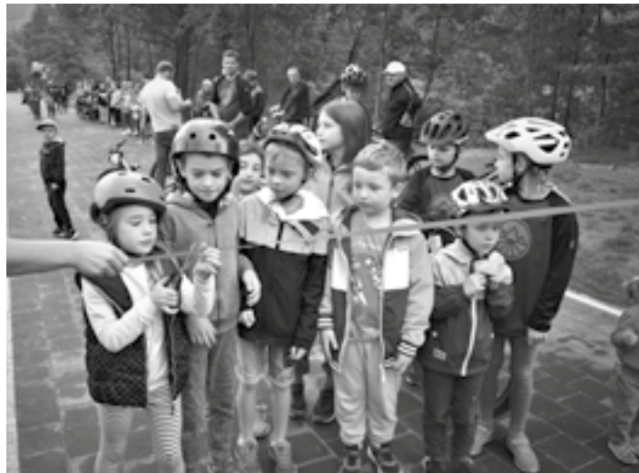
Otwarcie Bulwarów w Cięcinie

Prowadzone są intensywne prace związane z budową sali gimnastycznej przy Szkole Podstawowej nr 2 w Cięcinie. Na tę inwestycję uzyskaliśmy wsparcie finansowe z Ministerstwa Sportu i Turystyki. Rozpoczęto budowę pierwszego etapu centrum rekreacji i wypoczynku w gminie Węgierska Górka, w wyniku którego zostaną wybudowane baseny zewnętrzne i obiekty sportu, rekreacji i wypoczynku, inwestycja ta będzie współfinansowana w ramach Funduszu Inwestycji Lokalnych – Wsparcie Gmin Górskich i Polskiego Ładu. Ponadto przy wsparciu finansowym Funduszu Ochrony Gruntów Rolnych przebudowaliśmy drogę gminną rolniczą –