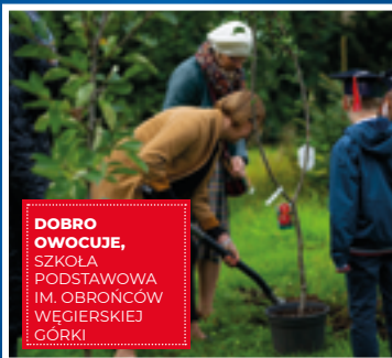
DOBRO OWOCUJE, SZKOŁA PODSTAWOWA IM. OBROŃCÓW WĘGIERSKIEJ GÓRKI