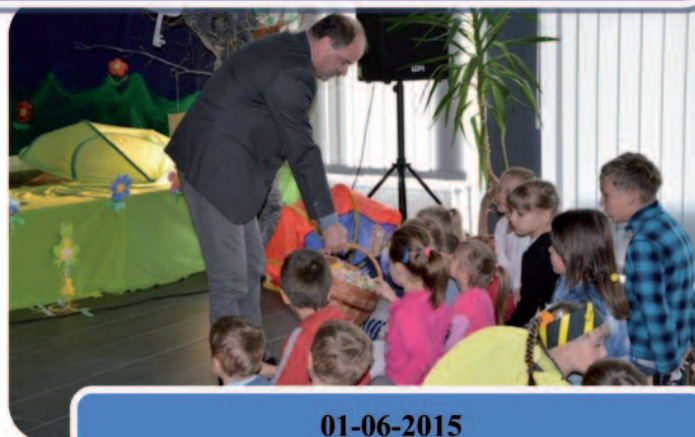
01-06-2015 Dzień Dziecka w Gminie Węgierska Górka