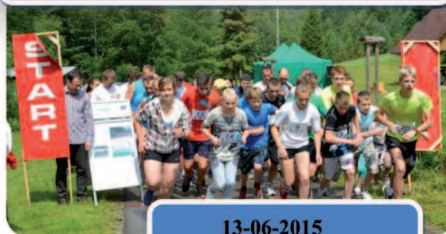
13-06-2015 XI Bieg na Jedną Milę