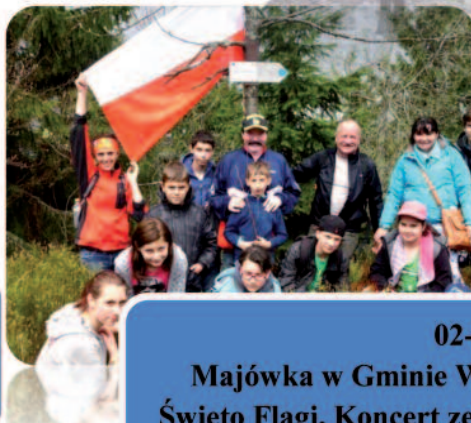
02-05-2015 Majówka w Gminie Węgierska Górka – Beskidzkie Święto Flagi, Koncert zespołu Dom o Zielonych Progach