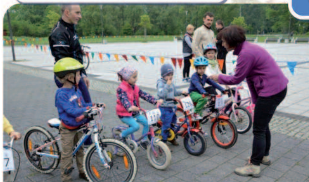
30-05-2015 XV Amatorski Cross Rowerowy o Puchar Wójta Gminy Węgierska Górka