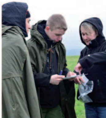
24-04-2015 Konkurs wiedzy o obronie Węgierskiej Górki