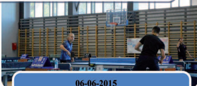
06-06-2015 Puchar Prezesa Banku Spółdzielczego w Węgierskiej Górce w Tenisie Stołowym